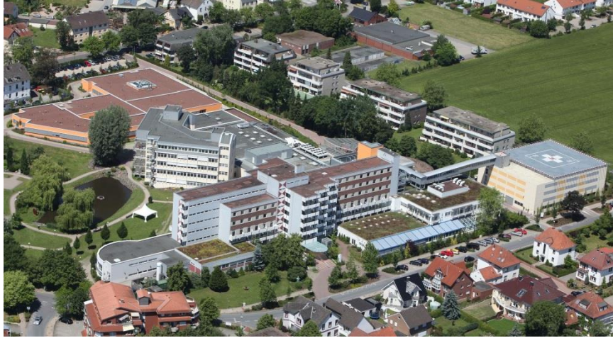
Schüchtermann-Klinik Bad Rothenfelde

Die Auswirkungen der offiziell für beendet erklärten Pandemie begleiten immer noch den Alltag. Die Aktionstage der ASH sind nicht nur seit vielen Jahren eine bewährte Tradition in der Schüchtermann-Klinik, einem integrierten Herzzentrum in Bad Rothenfelde am Teutoburger Wald, sondern dienen zunehmend einer neuen Herangehensweise zu der Thematik.